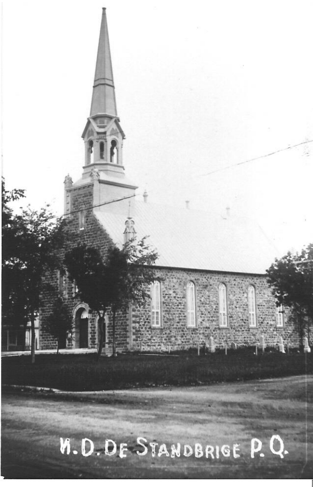
Cimetière Notre-Dame-des-Anges circa 1945